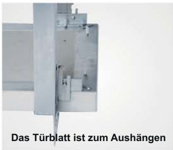
Das Türblatt ist zum Aushängen