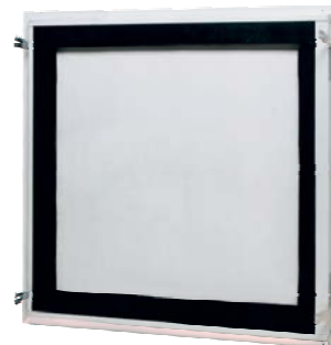
geprüft bis 600 x 600 mm

NEU: Jetzt auch in „luft- und staubdichter Ausführung“ auch in Edelstahl erhältlich!