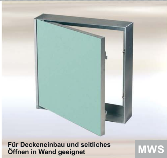
Für Deckeneinbau und seitliches Öffnen in Wand geeignet